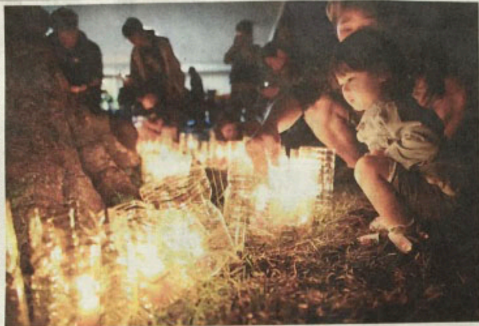
地震で亡くなった人と同じ数の49個のキャンドルに火をともし、追悼する子どもら(14日夜、熊本県益城町)。

熊本県で最大震度7を観測し、各地に深い爪痕を残した熊本地震は14日、発生から1か月を迎えた。死者49人、安否不明者1人。今も、約1万人が避難所での生活を続けている。熊本地震では、4月14日夜の前震、同16日未明の本震と、2度にわたって最大震度7の揺れを観測。震度1以上の地震は14日午後11時まで1446回を数える。気象庁は「今後最低1か月は熊本と阿蘇で震度6弱程度、大分で震度5強程度の余震に注意を」と呼びかけている。